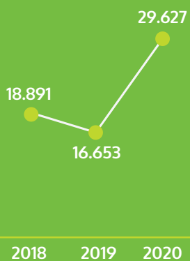
Valor Económico Distribuido (En millones de pesos)