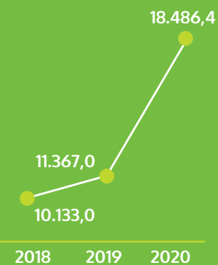
Valor Económico Directo Generado (En millones de pesos)